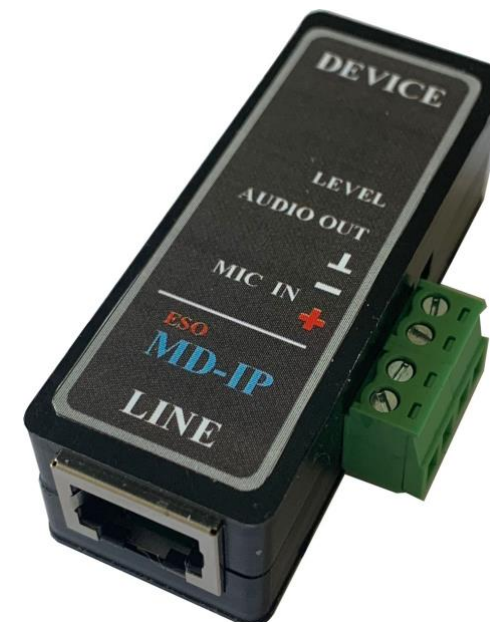
Адаптер микрофонный для IP камер MD-IP